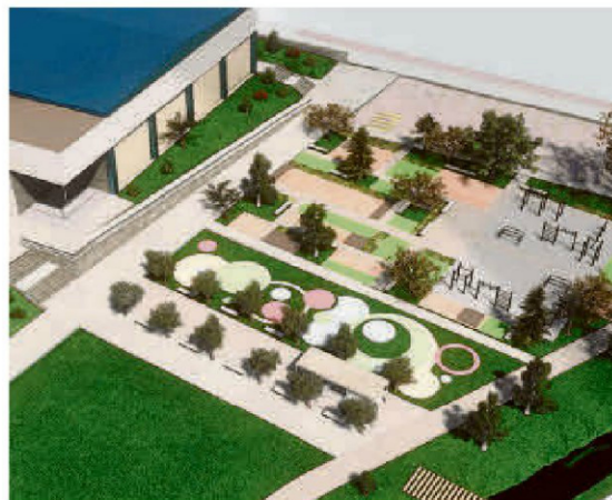
Vista aérea de los futuros jardines con los aparatos de “workout”.

T IRO con arco, esgrima, tenis de mesa, hockey o “workout” son disciplinas deportivas para cuya práctica no resulta fácil encontrar pistas públicas en Salamanca. Sin embargo, si habrá espacio para ellas en la “miniciudad” deportiva de Tejares. Y en el futuro no se descarta habilitar instalaciones para patinaje o trial. Son instalaciones “inexistentes o escasas” en el resto de la ciudad para deportes emergentes, que “cuentan con una demanda creciente y que actualmente no cuentan con lugares adaptados para su práctica”, según señalan los redactores del proyecto incluido en el plan Tormes+. De hecho, está previsto que en este recinto se puedan desarrollar ejercicios de calistenia