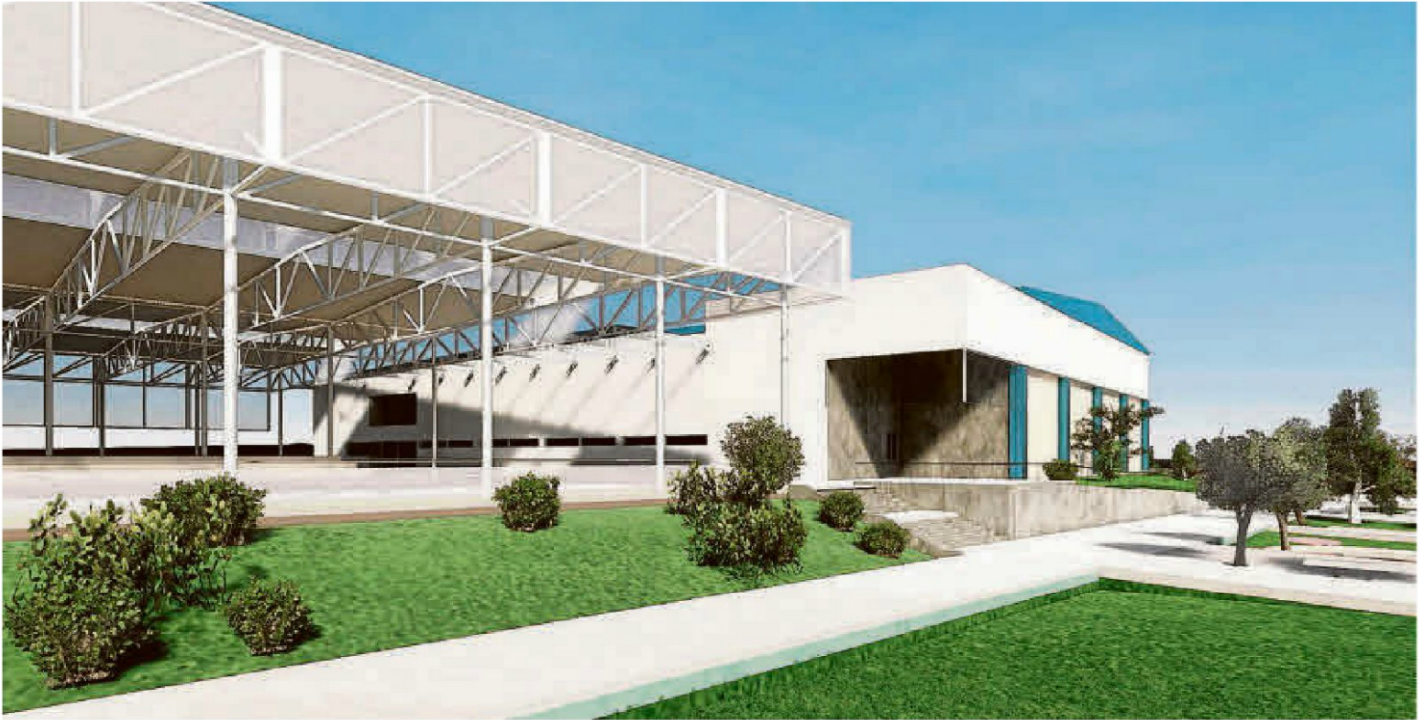
Recreación digital de la "miniciudad" deportiva del barrio de Tejares, en la que se observa el pabellón, junto a las pistas cubiertas.