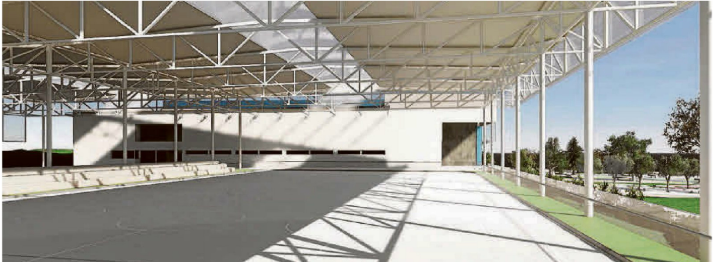
Diseño de la cubierta que se construirá sobre los campos exteriores de fútbol sala, balonmano, minibasket y hockey.